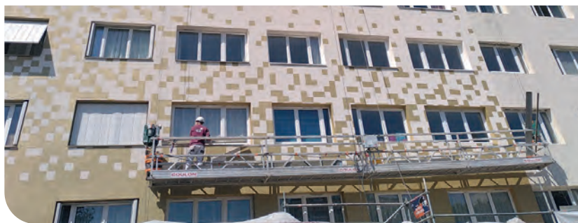
Chantier 37-43 rue Marcel Martinie à Vanves (92)

Le rôle du comité sera de suivre ces indicateurs sur les années à venir et de les faire évoluer en fonction de leur pertinence.