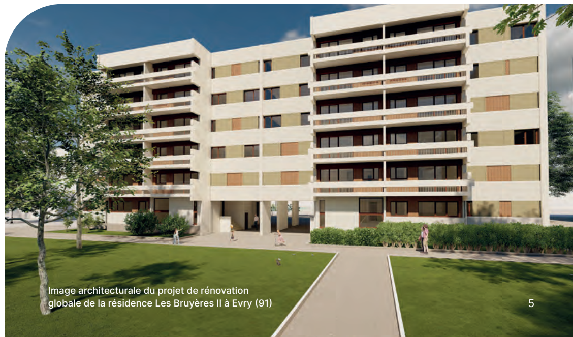
Image architecturale du projet de rénovation globale de la résidence Les Bruyères II à Evry (91)