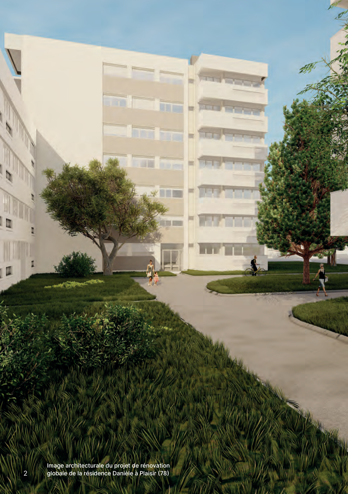
Image architecturale du projet de rénovation globale de la résidence Danièle à Plaisir (78)